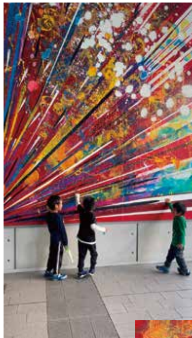
壁画で遊ぶ子どもたち

材料：ジェッソ、アクリル絵の具、箔、モデリングペースト 制作期間：構想：3年 制作期間：5ヶ月