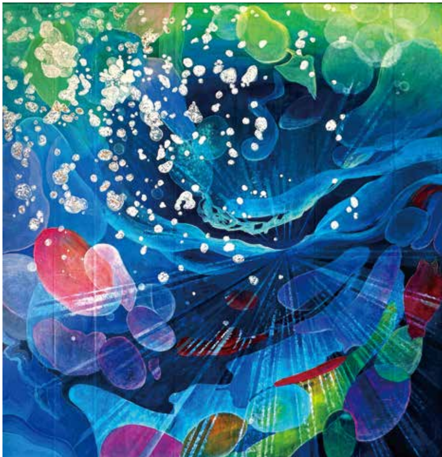
タイトル 音楽・平和 (Music・Peaceful)