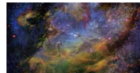
宇宙案 ↓ 決定